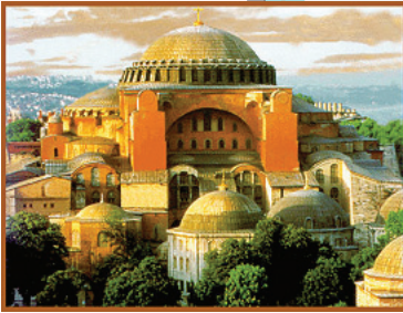
Hagia Sofia - extérieur