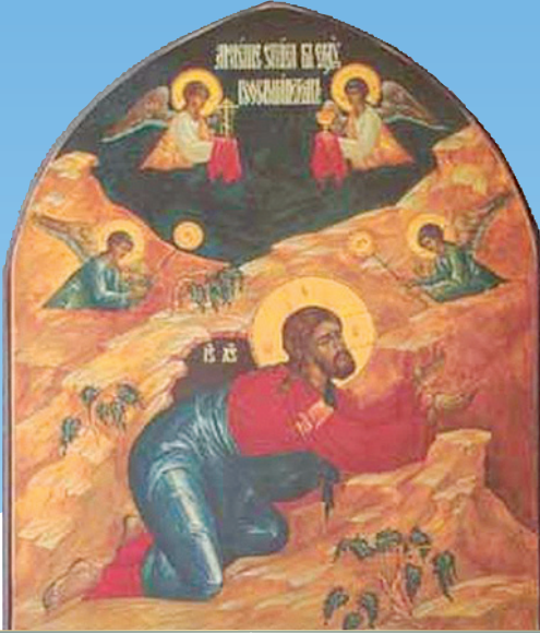
Jésus dans le désert.

Utilisez le code secret pour découvrir le message.